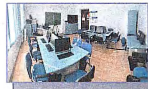
Кабинет «Основы бухгалтерского учета»

Оборудованные кабинеты, лаборатории и мастерские