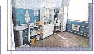
Лицензированный медицинский кабинет