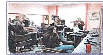
Лаборатория «Технология парикмахерского искусства»