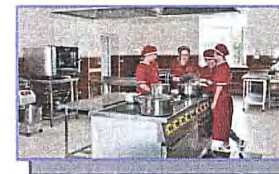
Лаборатория «Учебная кухня ресторана. Учебно- кондитерский цех»