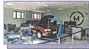
Мастерская «Техническое обслуживание и ремонт автомобильного транспорта»