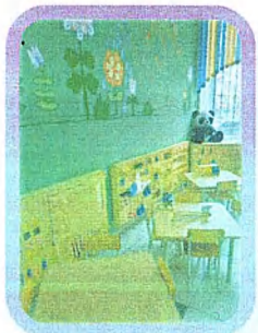
Лаборатория "Начальная школа"