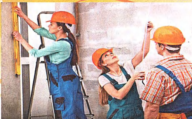
Профессия: 08.01.28 Мастер отделочных строительных и декоративных работ (Срок обучения на базе 9 классов - 1 г. 10 м.) (ТОП 50)