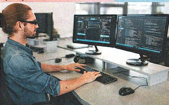
Специальность: 09.02.07 Информационные системы (ТОП 50) и программирование Квалификация: Специалист по информационным системам Срок обучения на базе 9 классов - 3 г. 10 м.