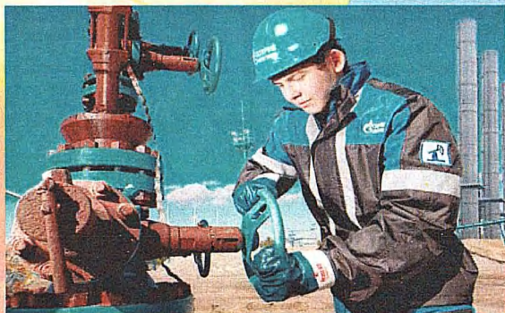
Специальность: 21.02.01 Разработка и эксплуатация нефтяных и газовых месторождений Квалификация: Техник-технолог Срок обучения на базе 9 классов - 3 г. 10 м.