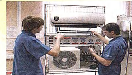
Специальность: 08.02.13 Монтаж и эксплуатация внутренних сантехнических устройств, кондиционирования воздуха и вентиляции Квалификация: Техник Срок обучения на базе 9 классов - 2 г. 10 м.