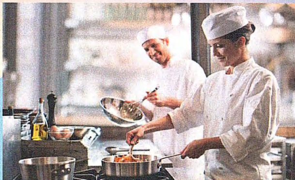
Профессия: 43.01.09 Повар, кондитер (Срок обучения на базе 9 классов - 2 г. 10 м.) (ТОП 50)