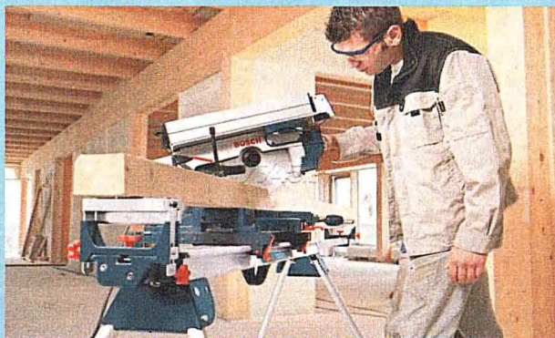
Профессия: 35.01.25 Оператор-станочник деревообрабатывающего оборудования (Срок обучения на базе 9 классов - 1 г. 10 м.)