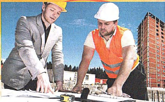
Специальность: 08.02.01 Строительство и эксплуатация зданий и сооружений Квалификация: Техник Срок обучения на базе 9 классов - 3 г. 10 м.