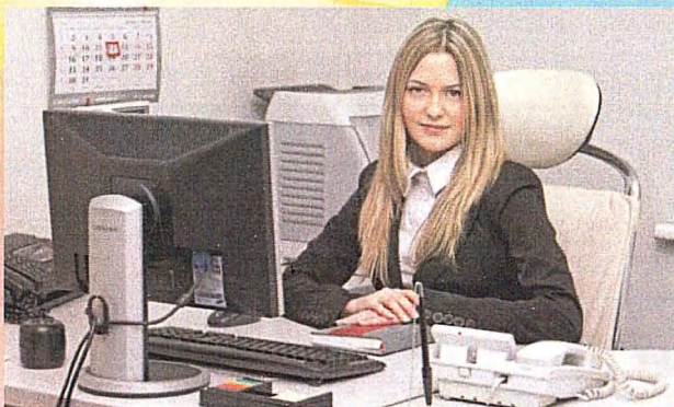
Профессия: 46.01.03 Делопроизводитель (Срок обучения на базе 9 классов - 1 г. 10 м.)