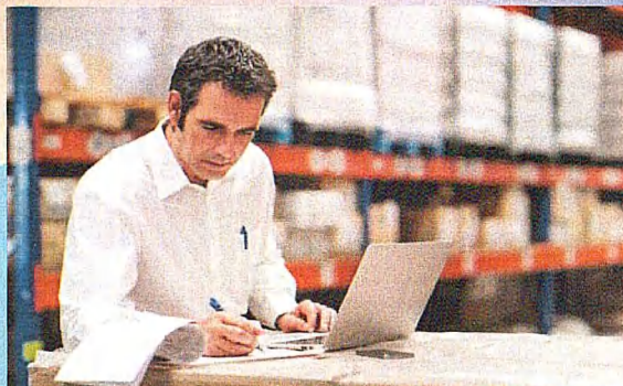
Специальность: 38.02.03 Операционная деятельность в логистике Квалификация: Операционный логист (ТОП 50) Срок обучения на базе 9 классов - 2 г. 10 м.