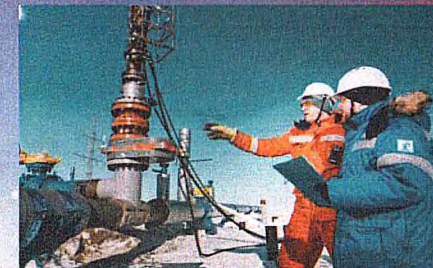
Специальность: 21.02.03 Сооружение и эксплуатация газонефтепроводов и газонефтехранилищ Квалификация: Техник Срок обучения на базе 9 классов - 3 г. 10 м.