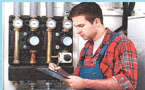
Специальность: 08.02.08 Монтаж и эксплуатация оборудования и систем газоснабжения Квалификация: Техник Срок обучения на базе 9 классов - 3 г. 10 м.