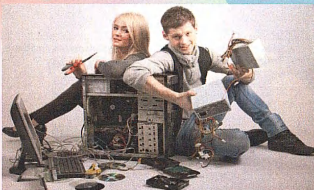
Профессия: 09.01.04 Наладчик аппаратных и программных средств инфокоммуникационных систем (Срок обучения на базе 9 классов - 1 г. 10 м.)