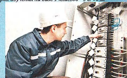
Специальность: 08.02.09 Монтаж, наладка и эксплуатация электрооборудования промышленных и гражданских зданий Квалификация: Техник Срок обучения на базе 9 классов - 2 г. 10 м.