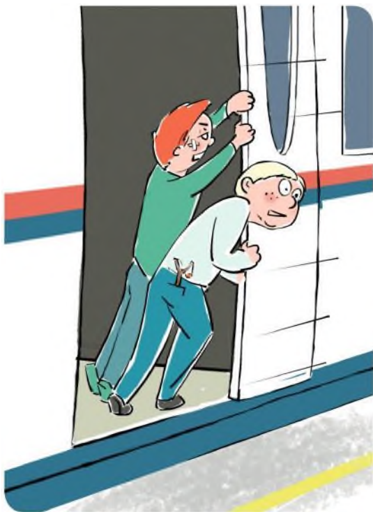
Не препятствуй автоматическому открытию/закрытию дверей вагонов!

Не создавай помех другим гражданам, осуществляя посадку/ высадку!