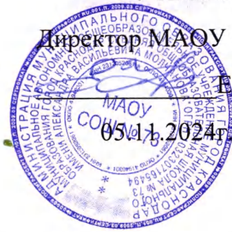
График посещения школьной столовой МАОУ СОШ № 73 родителями (законными представителями) обучающихся с родительским контролем в ноябре 2024г.